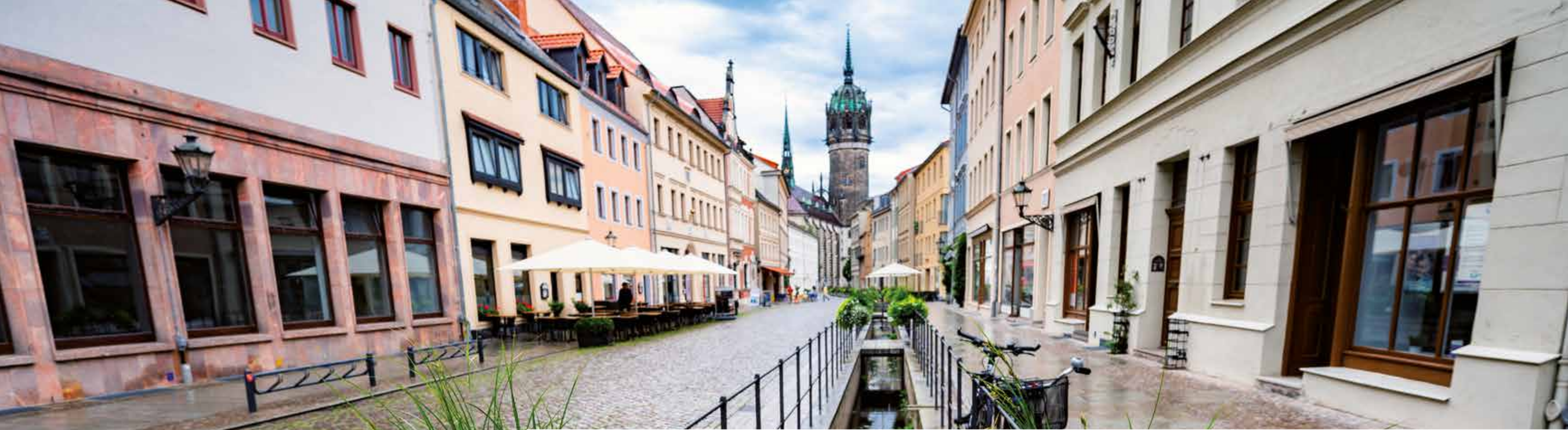
Alle: Lutherstadt Wittenberg